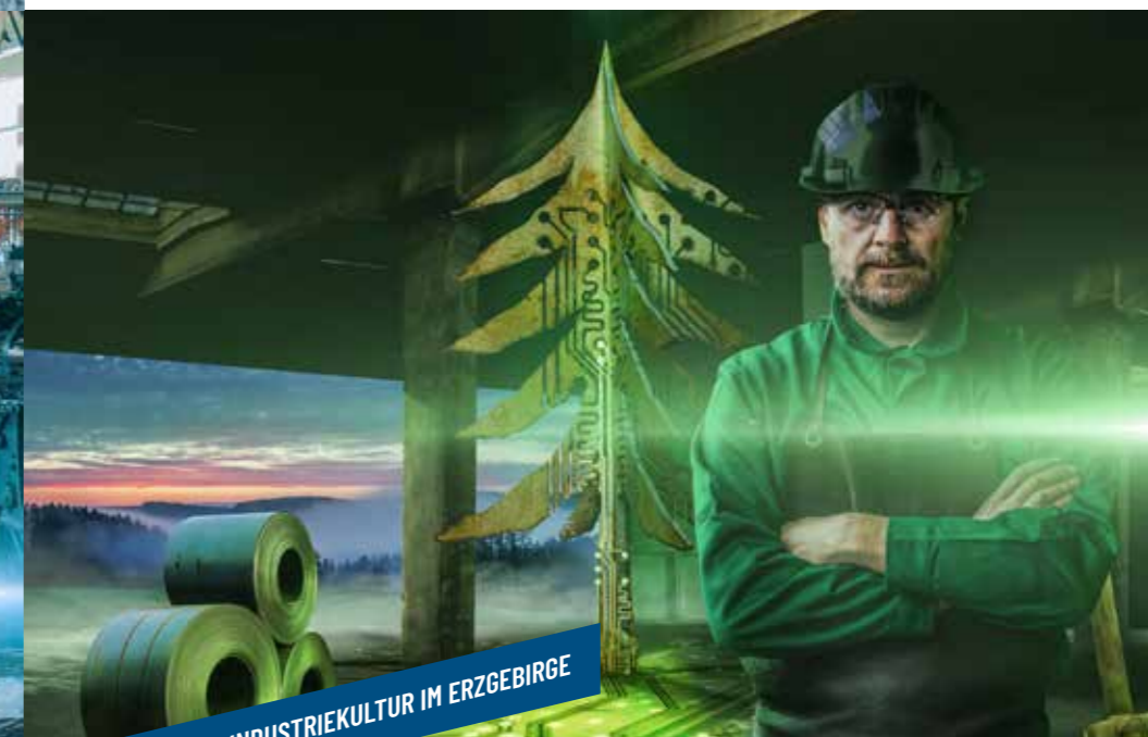
TAGE DER INDUSTRIEKULTUR IM ERZGEBIRGE

Zur Spätschicht bieten Ihnen verschiedene Unternehmen die Möglichkeit, hinter die Kulissen der modernen Produktionsstätten zu schauen und die Reise in die Gegenwart der Industriekultur fortzusetzen. Von der Werkzeugherstellung der Automobilzulieferer über die Verarbeitung von Lebensmitteln bis hin zur Erzeugung von Pharmazeutika ist für jeden Interessierten etwas dabei.