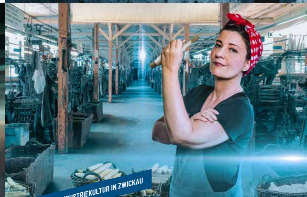
TAGE DER INDUSTRIEKULTUR IN ZWICKAU

dieser Stadt gern mitreißen. Die Industriekultur prägt Chemnitz aber auf ganz besondere Weise, denn die Wiege des deutschen Automobilbaus und der moderne Maschinenbau haben hier ihre Wurzeln. Bei den Tagen der Industriekultur feiern wir Chemnitzer Industrie (-kultur) und lassen diese zum Ereignis werden. Fühlen Sie sich eingeladen, tauchen Sie ein in die einzigartige Atmosphäre und seien Sie darauf vorbereitet, Chemnitz einmal anders zu erleben.